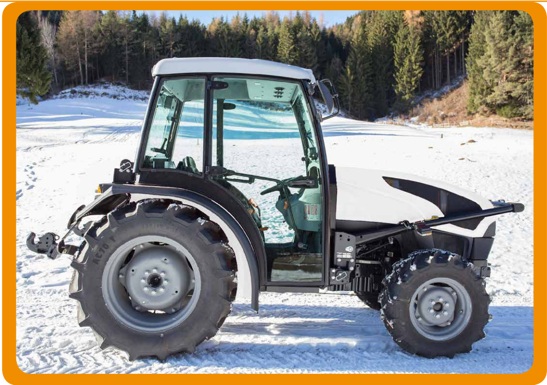
Lärmisolierung unter dem Armaturenbrett; Bodenmatten rx und lx (SERIENAUSSTATTUNG)